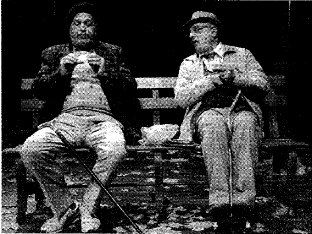
קומדיה אמטית